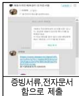
증빙서류,전자문서 함으로 제출