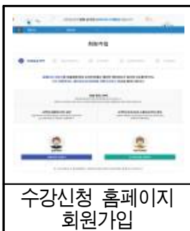
수강신청 홈페이지 회원가입