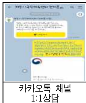
카카오톡 채널 1:1상담