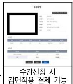
수강신청 시 감면적용 결제 가능

【사전제출이 어려울 경우】 할인대상자는 증빙자료를 제출하여야함으로 온라인으로 이용료 전액을 먼저 결제한 후 당일 14시 이후 ~ 마감 시간 사이 (평일20시, 토, 일, 공휴일 17시) 증빙자료를 지참하여 센터로 방문 하시면 취소 후 감면요금으로 재 결제 해드립니다.